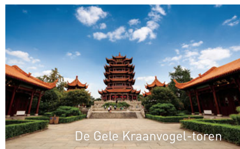
De Gele Kraanvogel-toren

De M/S Yangzi Explorer houdt halt in Wuhan. Deze agglomeratie is ontstaan uit een fusie van de steden Hankou en Wuchang en is de hoofdstad van de provincie Hubei. Deze stadsregio ligt bij de samenvloeiing van de Yangtze en de Han-rivier. Her en der zijn nog sporen te vinden van de westerse concessies uit de 19de eeuw. We bezoeken er het Hubei