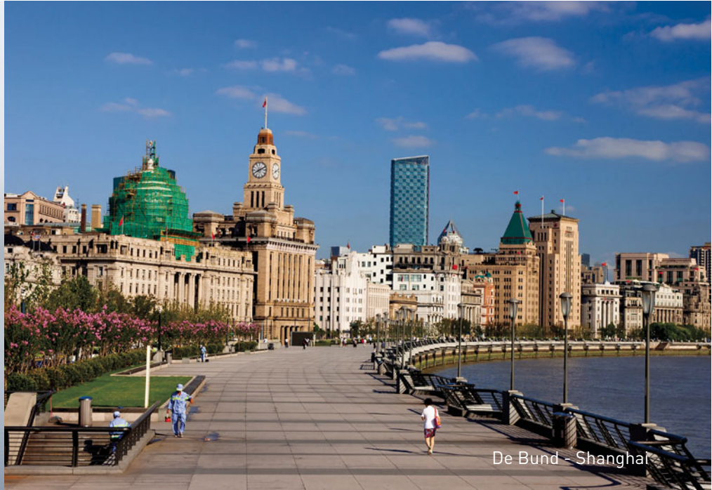
De Bund - Shanghai